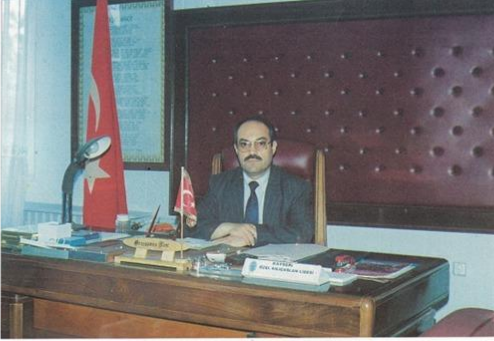
GENOSMAN MART OKUL MÜDÜRÜ

DERGİ ANADOLU ARALIK 2024 93.SAYIDA'Kİ YAZIM